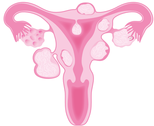
Gebärmutter mit Myomen